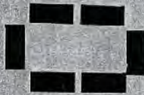
Geltungsbereich des Deckblattes